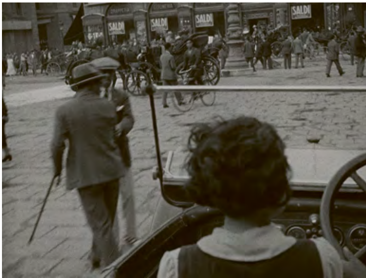
Originalnegativ, britischer Verleih