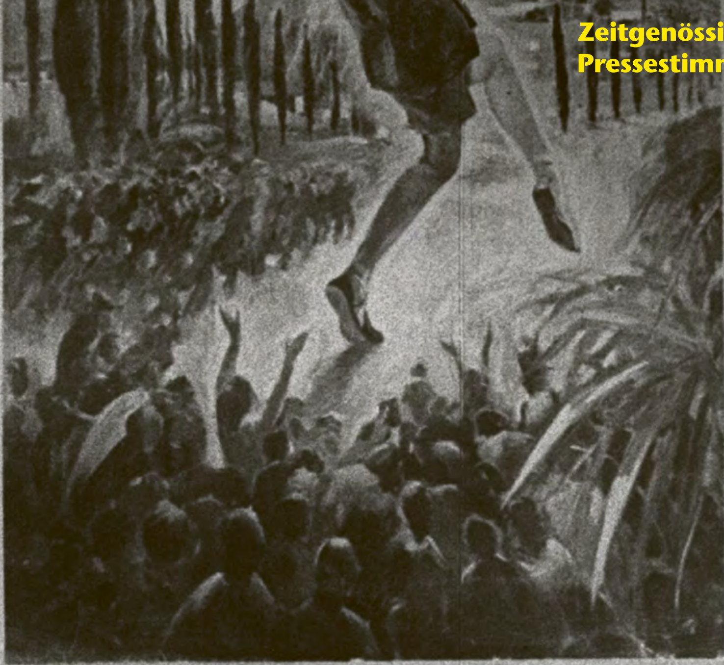
„Der Geiger von Florenz.“