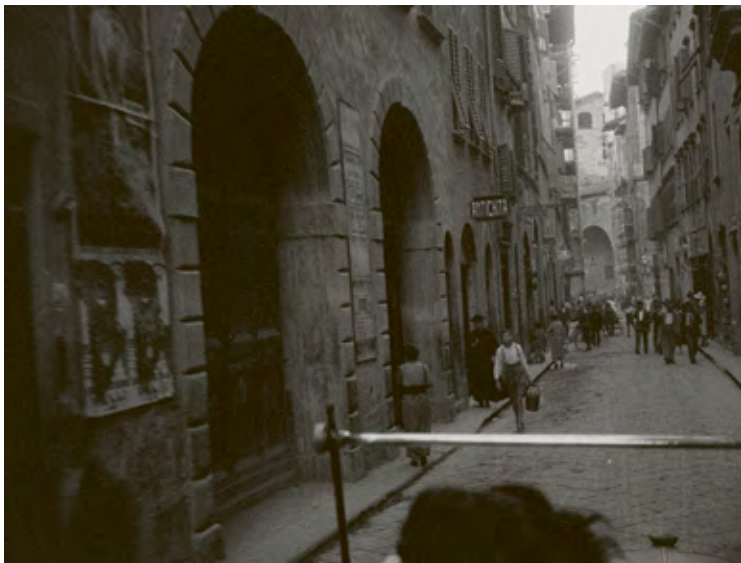
Originalnegativ, britischer Verleih